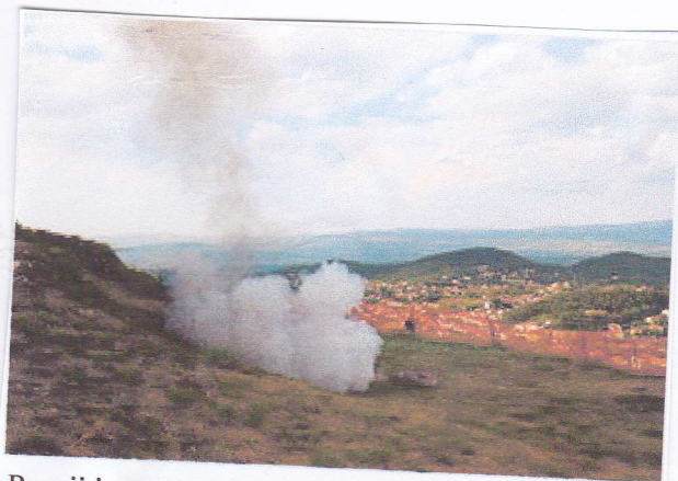
Pucnji iz mačkula rano ujutro

Dana 15. studenoga 2010. Sinjska alka je upisana na UNESCO-v popis nematerijalne svjetske baštine u Europi. [1][2]